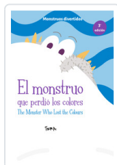
MONSTRUO QUE PERDIO LOS COLORES, EL (BILINGUE ESP/ING) GOMEZ, ISRAEL