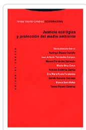
JUSTICIA ECOLÓGICA Y PROTECCIÓN DEL MEDIO MEDIO VICENTE, TERESA