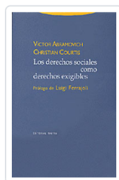
# DERECHOS SOCIALES COMO DERECHOS EXIGIBLES ABRAMOVICH, VICTOR