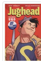
JUGHEAD, 1 ZDARSKY, CHIP