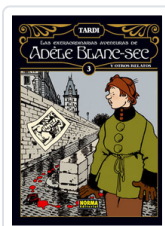
ADELE BLANC- SEC, 3 TARDI