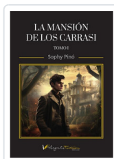
MANSION DE LOS CARRASSI (TOMO I) PINO, SOPHY