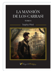
MANSION DE LOS CARRASI (TOMO I) PINO, SOPHY