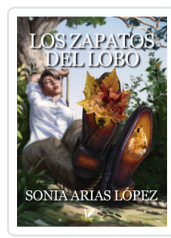
ZAPATOS DEL LOBO, LOS ARIAS, SONIA