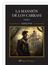
MANSION DE LOS CARRASSI (TOMO I) PINO, SOPHY