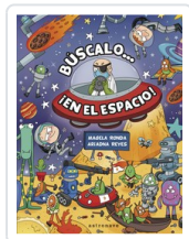
BUSCALO EN EL ESPACIO RONDA, MAGELA