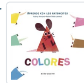
LOS RATONCITOS, 2 COLORES BOUQUET, AUDREY