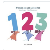
LOS RATONCITOS, 1, 2, 3 BOUQUET, AUDREY