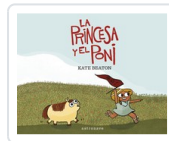
PRINCESA Y EL PONI BEATON, KATE