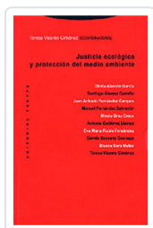
JUSTICIA ECOLÓGICA Y PROTECCIÓN MEDIO VICENTE, TERESA