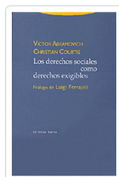
# DERECHOS SOCIALES COMO DERECHOS EXIGIBLES ABRAMOVICH, VICTOR