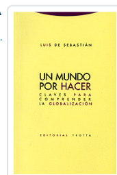
UN MUNDO POR HACER DE SEBASTIAN, LUIS