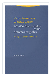
# DERECHOS SOCIALES COMO DERECHOS EXIGIBLES ABRAMOVICH, VICTOR