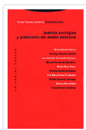
JUSTICIA ECOLÓGICA Y PROTECCIÓN MEDIO VICENTE, TERESA