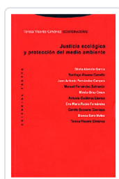
JUSTICIA ECOLÓGICA Y PROTECCIÓN MEDIO VICENTE, TERESA