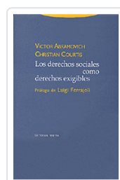
# DERECHOS SOCIALES COMO DERECHOS EXIGIBLES ABRAMOVICH, VICTOR