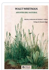
APUNTES DEL NATURAL WHITMAN, WALT