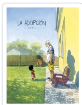
ADOPCION, 1 QINAYA ZIDROU/ MONIN