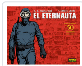
ETERNAUTA, EL OESTERHELD, H.G.