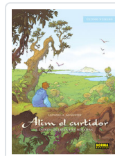
ALIM EL CURTIDOR, 4 DONDE QUEMAN LUPANO