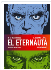
ETERNAUTA, 2 OESTERHELD, H.G.