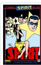
ARCHIVOS THE SPIRIT, 11 EISNER, WILL