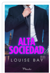
ALTA SOCIEDAD BAY, LOUISE