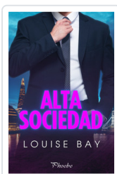
ALTA SOCIEDAD BAY, LOUISE