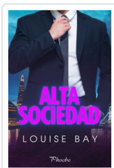
ALTA SOCIEDAD BAY, LOUISE