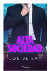
ALTA SOCIEDAD BAY, LOUISE