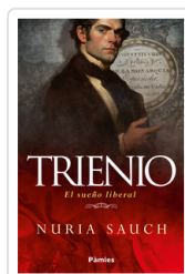
TRIENIO. EL SUEÑO LIBERAL SAUCH, NURIA