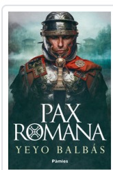
PAX ROMANA BALBAS, YEYO