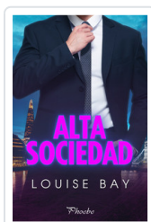
ALTA SOCIEDAD BAY, LOUISE