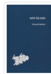
ANTE TUS OJOS MATTON, FRANCOIS