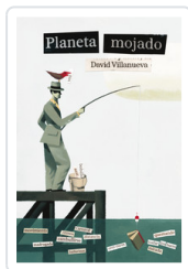
PLANETA MOJADO VILLANUEVA, DAVID