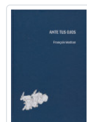
ANTE TUS OJOS MATTON, FRANCOIS