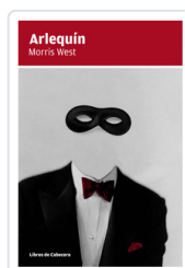
ARLEQUIN WEST, MORRIS