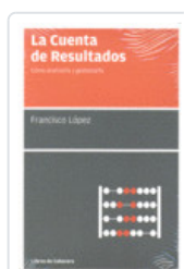
** CUENTA DE RESULTADOS LOPEZ, FRANCISCO