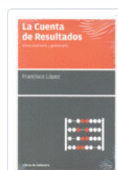
** CUENTA DE RESULTADOS LOPEZ, FRANCISCO