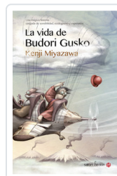
VIDA DE BUDORI GUSKO MIYAZAWA, KENJI