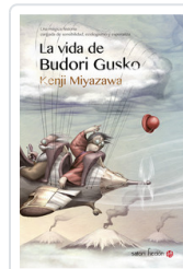
VIDA DE BUDORI GUSKO MIYAZAWA, KENJI