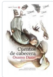
CUENTOS DE CABECERA DAZAI, OSAMU