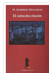
ESTRECHO RINCON MAUGHAM, SOMERSET