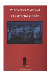
ESTRECHO RINCON MAUGHAM, SOMERSET