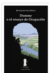
DOMME O EL ENSAYO OCUPACION AUGIERAS, FRANCOIS