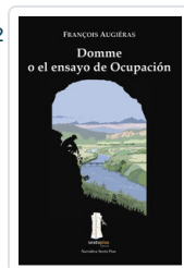
DOMME O EL ENSAYO OCUPACION AUGIERAS, FRANCOIS