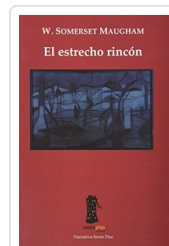
ESTRECHO RINCON MAUGHAM, SOMERSET