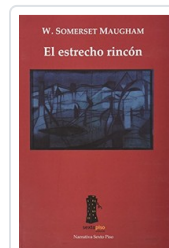
ESTRECHO RINCON MAUGHAM, SOMERSET