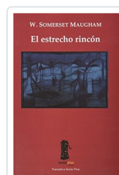
ESTRECHO RINCON MAUGHAM, SOMERSET