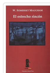
ESTRECHO RINCON MAUGHAM, SOMERSET