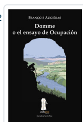
DOMME O EL ENSAYO OCUPACION AUGIERAS, FRANCOIS