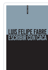
ESCRIBIR CON CACA FABRE, LUIS