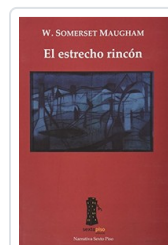
ESTRECHO RINCON MAUGHAM, SOMERSET