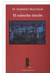
ESTRECHO RINCON MAUGHAM, SOMERSET