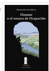
DOMME O EL ENSAYO OCUPACION AUGIERAS, FRANCOIS