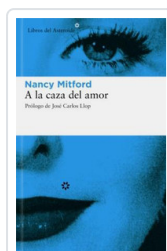
A LA CAZA DEL AMOR MITFORD, NANCY