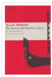
EN BUSCA DEL BARÓN CORVO SYMONS, A.J.A