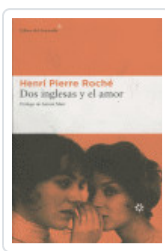
DOS INGLESAS Y EL AMOR ROCHE, HENRI