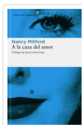
A LA CAZA DEL AMOR MITFORD, NANCY