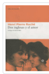
DOS INGLESAS Y EL AMOR ROCHE, HENRI