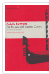
EN BUSCA DEL BARÓN CORVO SYMONS, A.J.A