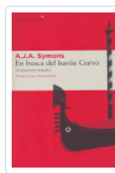
EN BUSCA DEL BARÓN CORVO SYMONS, A.J.A