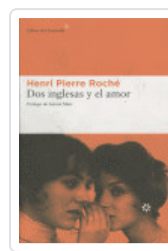
DOS INGLESAS Y EL AMOR ROCHE, HENRI