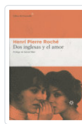
DOS INGLESAS Y EL AMOR ROCHE, HENRI