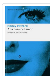
A LA CAZA DEL AMOR MITFORD, NANCY