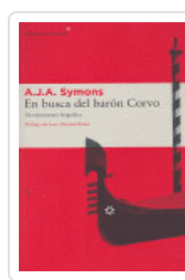
EN BUSCA DEL BARÓN CORVO SYMONS, A.J.A