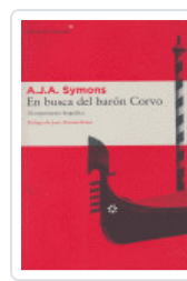
EN BUSCA DEL BARÓN CORVO SYMONS, A.J.A