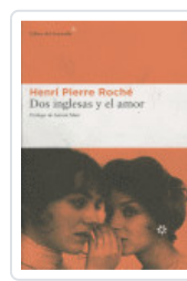
DOS INGLESAS Y EL AMOR ROCHE, HENRI