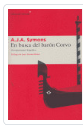
EN BUSCA DEL BARON CORVO SYMONS, A.J.A