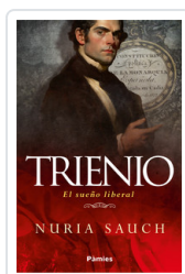
TRienio. EL SUENO LIBERAL SAUCH, NURIA