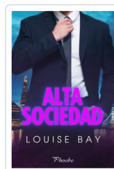
ALTA SOCIEDAD BAY, LOUISE