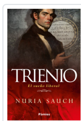
TRIENIO. EL SUÑO LIBERAL SAUCH, NURIA