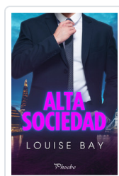
ALTA SOCIEDAD BAY, LOUISE