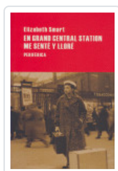
EN GRAN CENTRAL STATION SMART, ELIZABETH