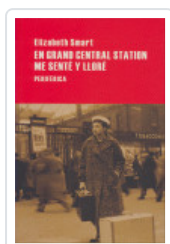
EN GRAN CENTRAL STATION SMART, ELIZABETH