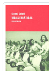
VIDAS ERRATICAS CELATI, GIANNI