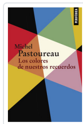
COLORES DE NUESTROS RECUERDOS, LOS PASTOUREAU, MICHEL