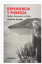
EXPERIENCIA Y POBREZA VALERO, VICENTE