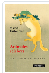
ANIMALES CELEBRES PASTOUREAU, MICHEL