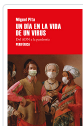
UN DIA EN LA VIDA DE UN VIRUS PITA, MIGUEL