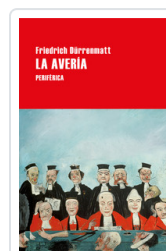
AVERIA, LA DURRENMATT, FRIEDRICH