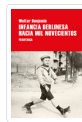
INFANCIA BERLINESA HACIA MIL NOVECIENTOS BENJAMIN, WALTER