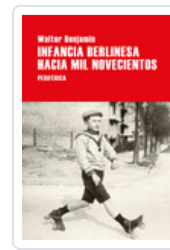
INFANCIA BERLINESA HACIA MIL NOVECIENTOS BENJAMIN, WALTER