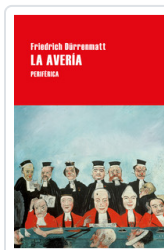
AVERIA, LA DURRENMATT, FRIEDRICH