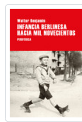
INFANCIA BERLINESA HACIA MIL NOVECIENTOS BENJAMIN, WALTER