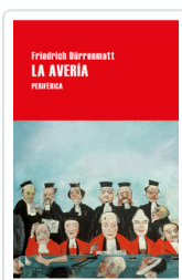
AVERÍA, LA DURRENMATT, FRIEDRICH