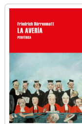
AVERIA, LA DURRENMATT, FRIEDRICH