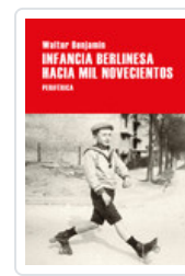
INFANCIA BERLINESA HACIA MIL NOVECIENTOS BENJAMIN, WALTER